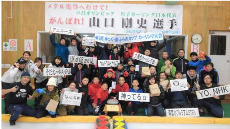
↑ゆっく南ふらのカップカーリング大会（11月11日） 町内、中富良野から8チームが参加し、笑いあり、叫び声ありの 熱戦を繰り広げました。小中学生チーム「神ってるα」が優勝！