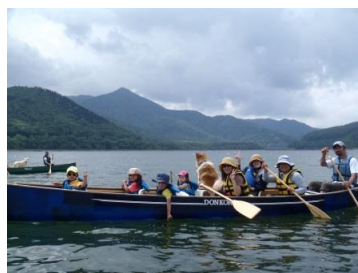
7月 ふれあいカヌー体験