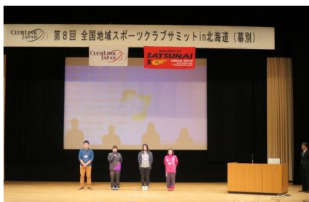
11月 全国SCサミットin北海道（幕別）