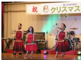
12月 第1回ゆっく・みなみふらのカップ 12月 フラ・商工会クリスマスライブ カーリング大会