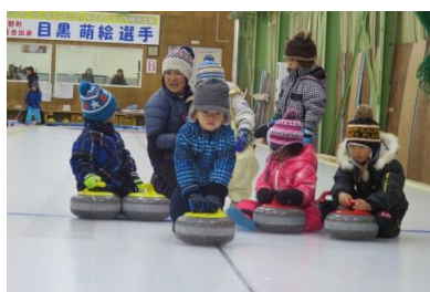
12月 Family!カーリング体験教室